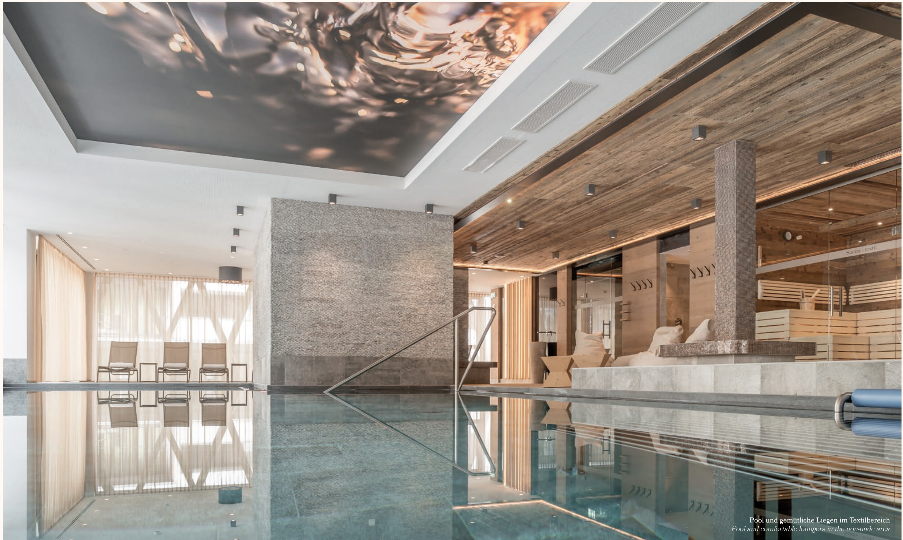
Pool und gemütliche Liegen im Textilbereich Pool and comfortable loungers in the non-nude area