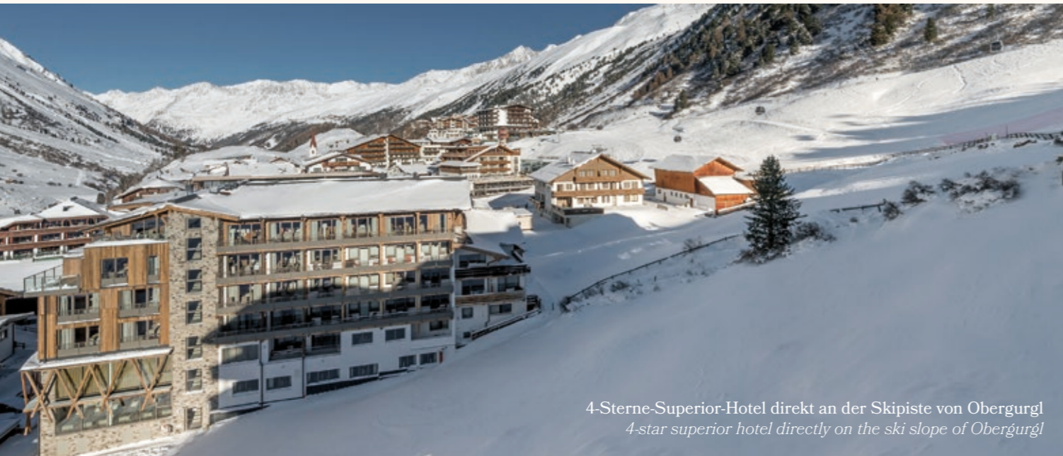
4-Sterne-Superior-Hotel direkt an der Skipiste von Obergurgl 4-star superior hotel directly on the ski slope of Obergurgl

Folgen Sie den Spuren von Fuchs und Hase – mitten hinein in unsere wunderschöne Heimat. Hier im Ötztal, wo der Winter wie im Bilderbuch erstrahlt, erfüllt sich schon bald einer Ihrer ganz persönlichen Winterträume. Wollten Sie schon immer das Skitourengehen oder Schneeschuhwandern ausprobieren? Dies ist Ihre Gelegenheit! Unser Nachbar, ein Freund des Hauses, ist geprüfter Tourenguide und führt Sie sicher in die Höhen der Ötztaler Bergwelt. Freuen Sie sich auf magische Tage voller Abwechslung und exquisite Winterabende an diesem besonderen Ort in Obergurgl.