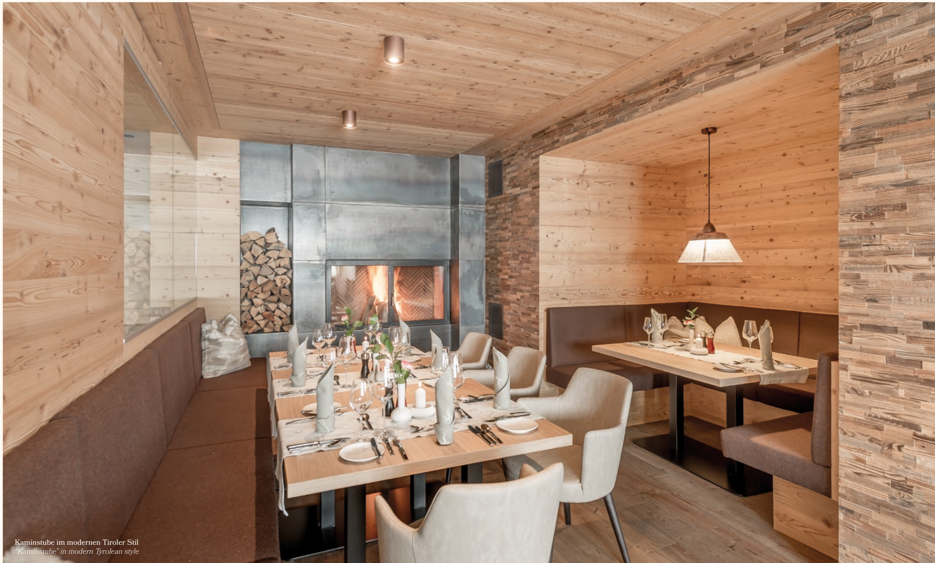
Kaminstube im modernen Tiroler Stil "Kaminstube" in modern Tyrolean style