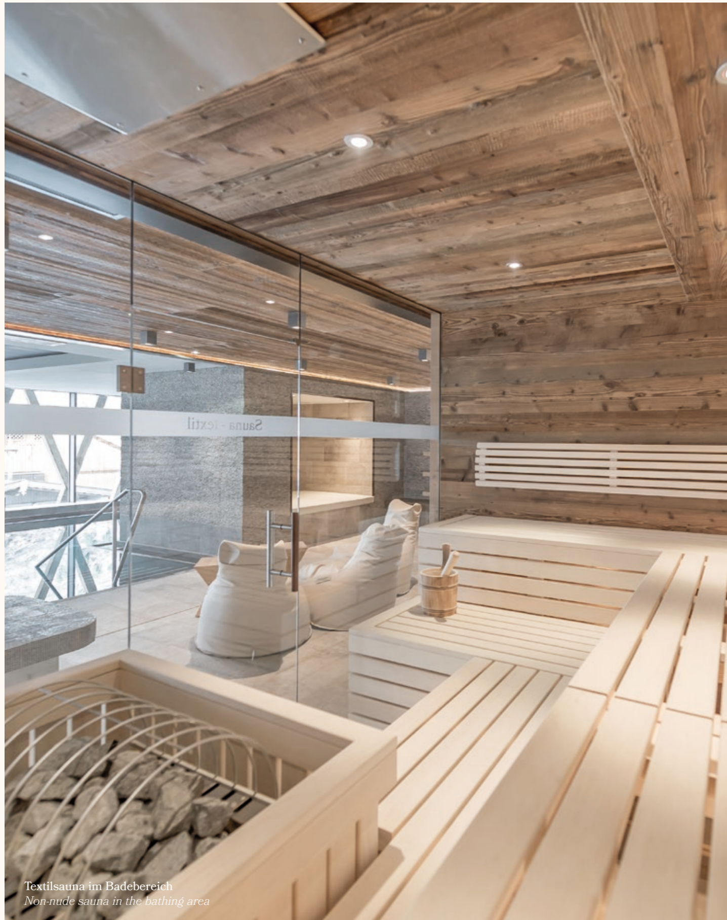
Textilsauna im Badebereich Non-nude sauna in the bathing area