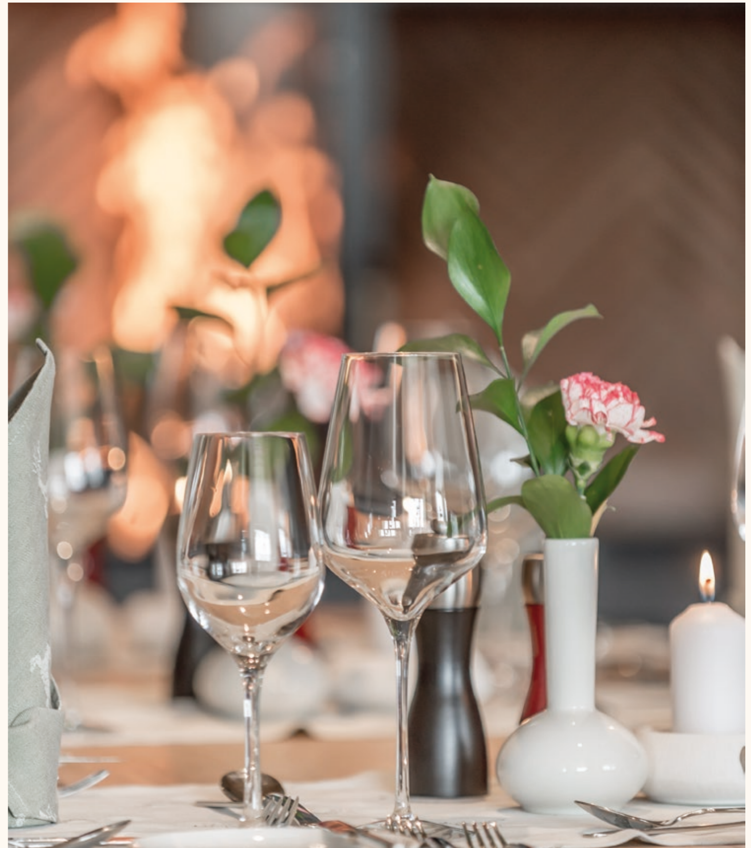
KULINARIK AUF HÖCHSTEM NIVEAU ZELEBRIEREN CELEBRATE CULINARY DELIGHTS AT THE HIGHEST LEVEL