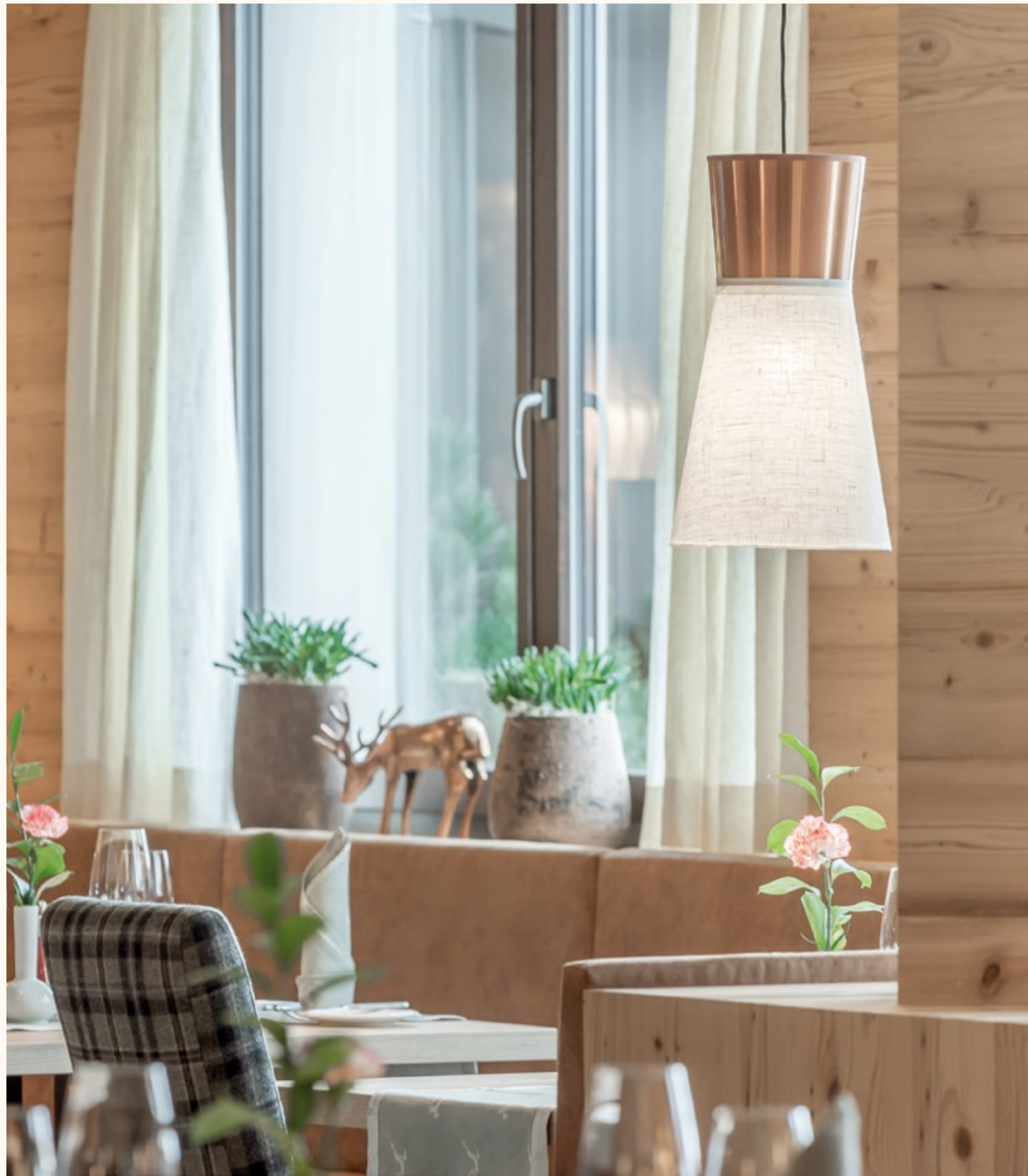
TRADITION MODERN ERLEBEN EXPERIENCE TRADITION IN A MODERN WAY