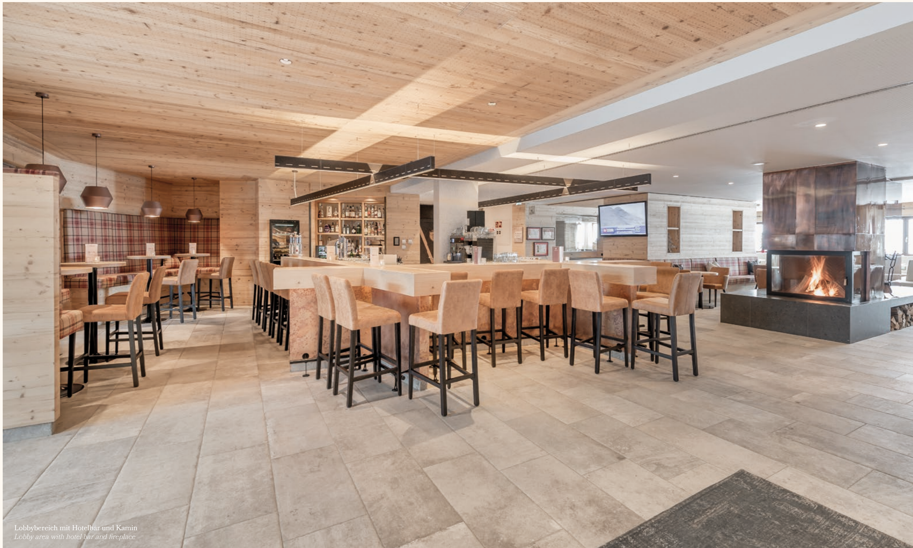
Lobbybereich mit Hotelbar und Kamin Lobby area with hotel bar and fireplace