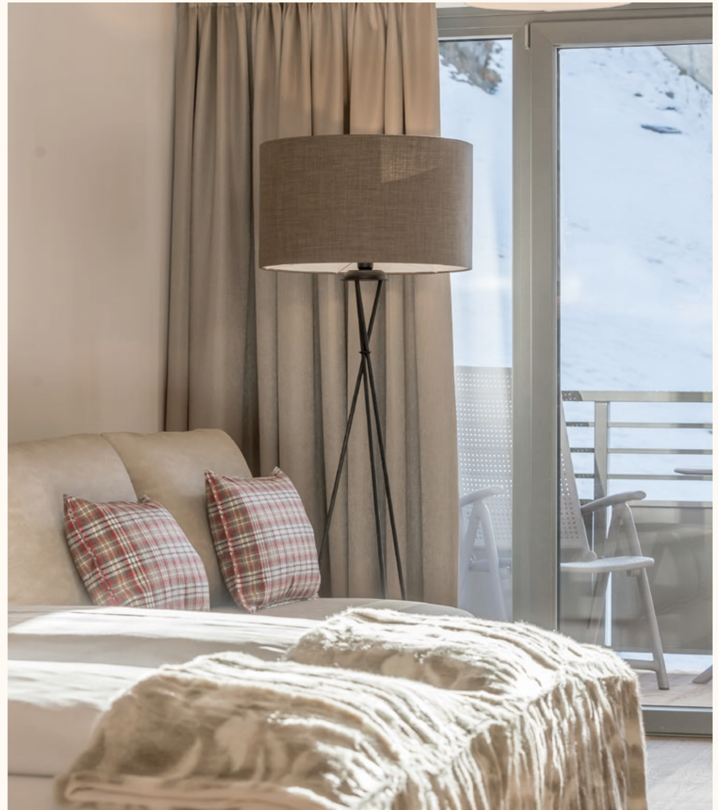
SCHLAFEN MIT ALPINEM HOCHGEFÜHL SLEEP WITH A HIGH ALPINE FEELING