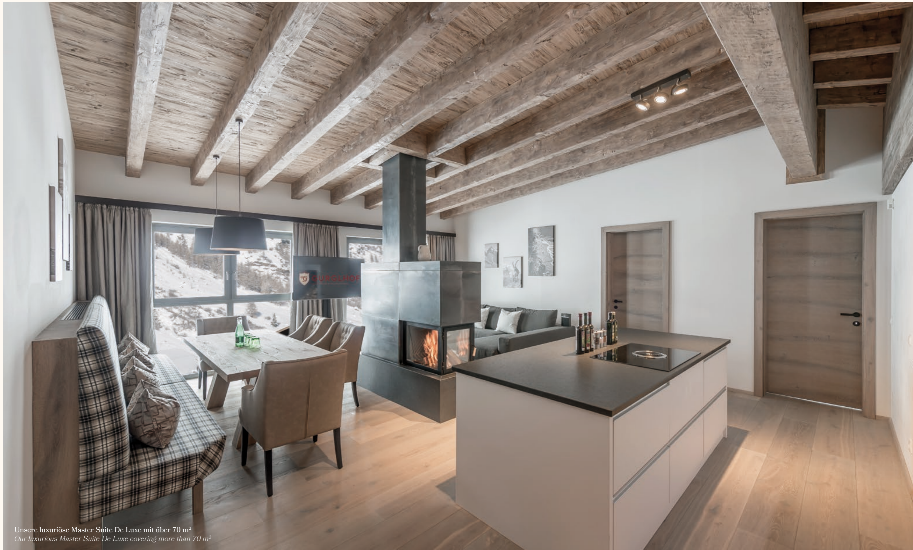
Unsere luxuriöse Master Suite De Luxe mit über 70 m 2 Our luxurious Master Suite De Luxe covering more than 70 m 2