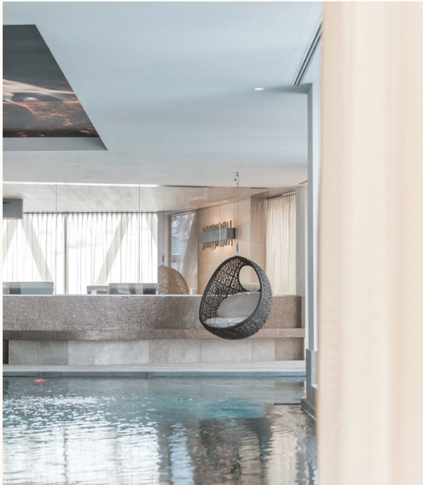
EINTAUCHEN IM BERG-SPA IMMERSE YOURSELF IN THE MOUNTAIN SPA